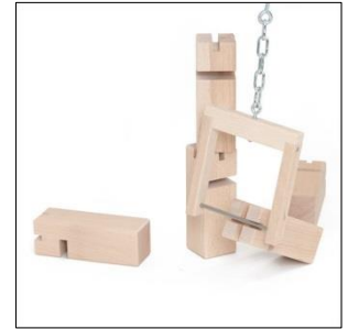
Methode Klotz aufstellen